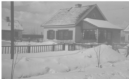
oben: Kleiner Haustyp "deutsch", unten: "Finnenhäuser"